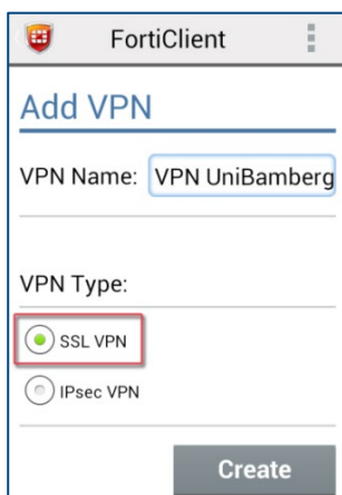
Abbildung 2: Verbindungseinrichtung

Beim ersten Starten der Anwendung erscheint ein Fenster, in dem Sie gebeten werden, einen Namen für die neue Verbindung einzugeben.