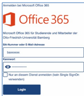
Abbildung 2: Eingabe Anmeldedaten

Sie werden Sie auf die Anmeldeseite der Universität weitergeleitet. Tragen Sie dort bitte Ihre BA-Nummer und das zugehörige Kennwort ein. Klicken Sie auf Login . Nach einem Moment ist das Konto eingerichtet und Sie können den Einrichtungsdialog mit einem Klick auf Fertig beenden.