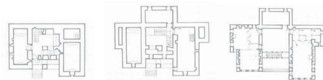
Das sogenannte Zekate-Haus (benannt nach der Familie des Besitzers), Beispiel eines typischen zweiflügeligen Wehrhauses.

ligen, spezialisierten Einzelhandel im historischen Basarviertel hervorgebracht hat, lassen sich große Gewinner noch nicht ausmachen. Nach eigenen Angaben profitieren nur 4,5 Prozent der Bewohner im historischen Stadtgebiet direkt vom Tourismus.