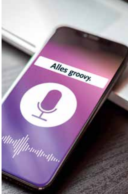
Eine Spracherkennungssoftware kann unter anderem Fragen beantworten.

KI-Systeme nicht. Ein tiefes neuronales Netz, das sehr zuverlässig Verkehrszeichen erkennt, kann keine Tierarten erkennen oder Witze erzählen. Künstliche Intelligenz umfasst meistens einen ganz engen Bereich.